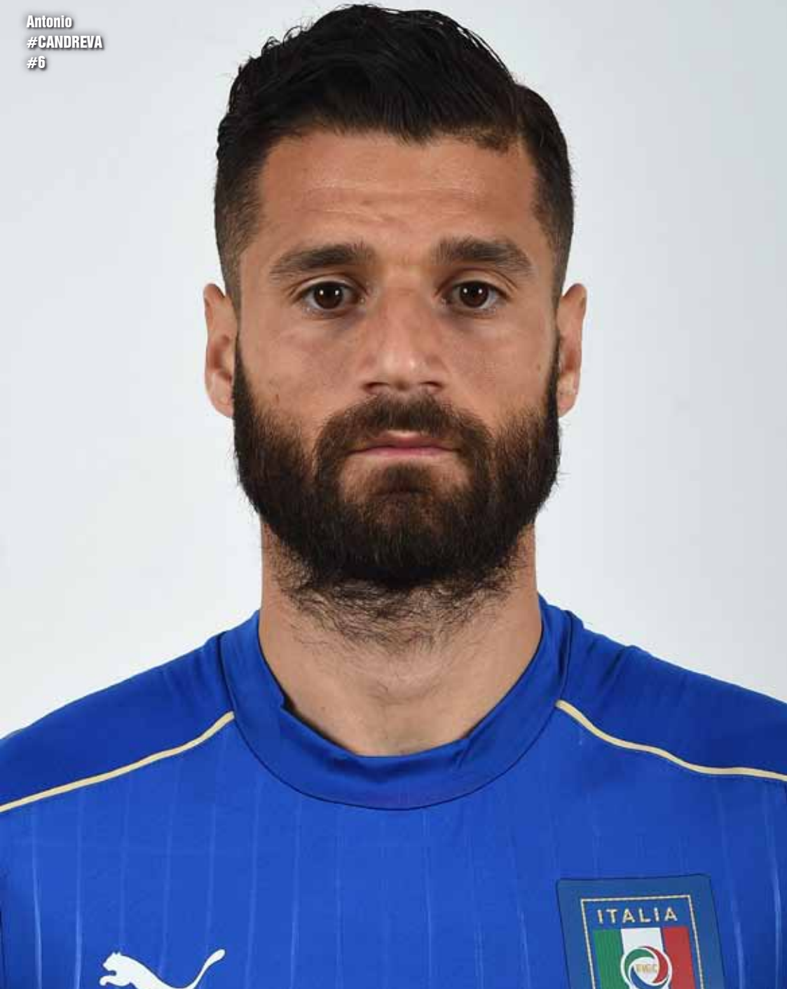
Antonio #CANDREVA #6