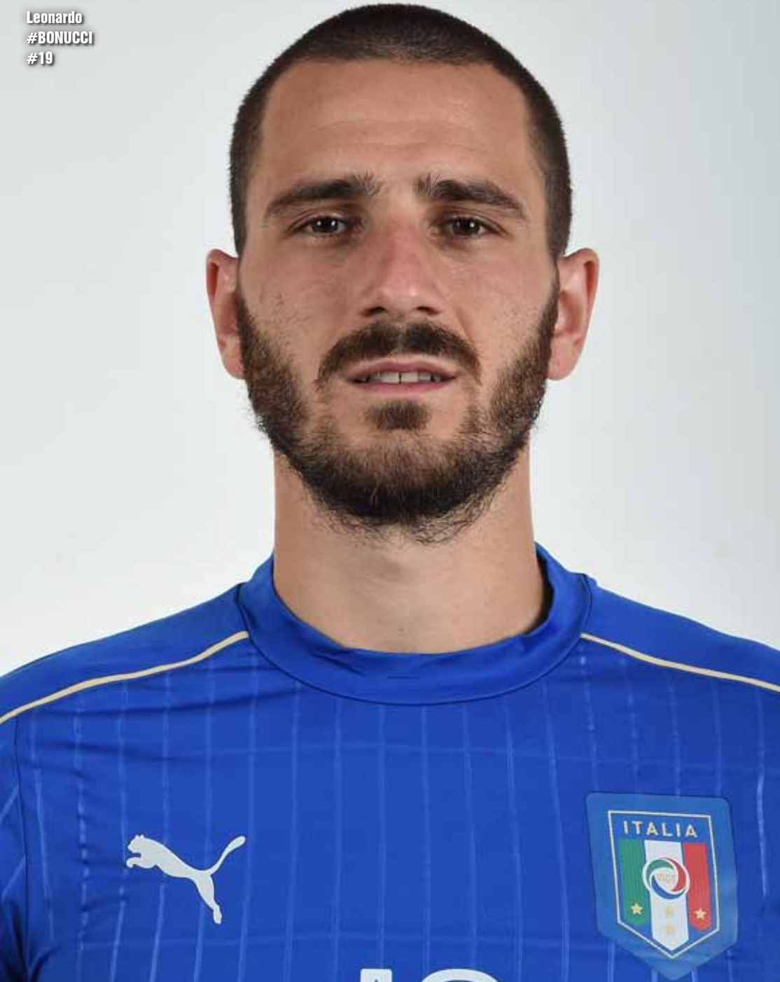
Leonardo #BONUCCI #19