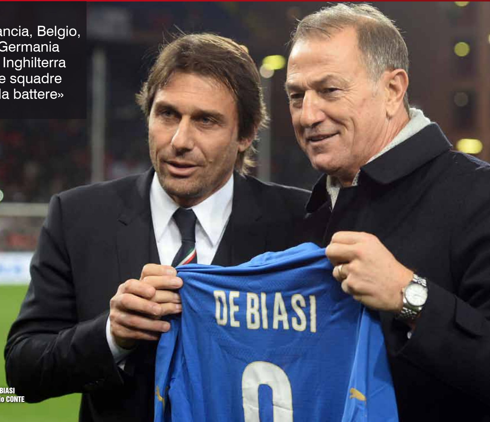
Gianni De BIASI con Antonio CONTE

«Francia, Belgio, Germania e Inghilterra le squadre da battere»