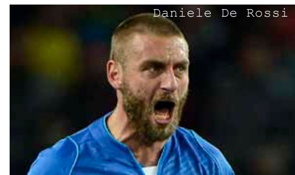
Daniele De Rossi

“Da risolvere la situazione De Rossi, in attesa del mercato”